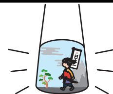
④ライトを点灯させると絵の完成!