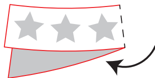
②点線を山折りにする